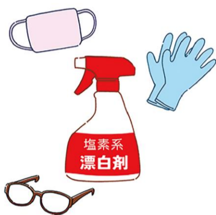
塩素系漂白剤はゴム手袋やメガネ、マスクなどをしてご使用を。

あり、酸性のものと混ぜると危険なので、ご注意ください。 浴室を使用後、吸水スポンジやスクイーズで水気を取ると掃除の負担が軽くなります。