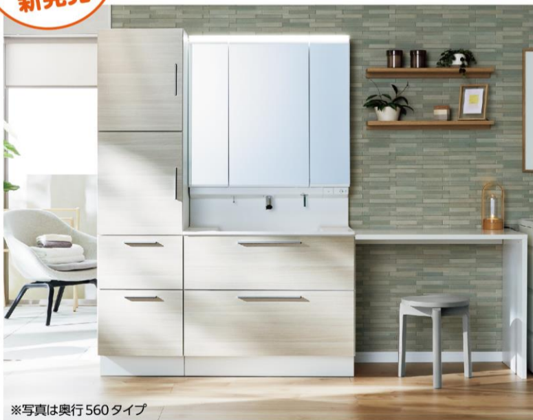
※写真は奥行560タイプ

新しい日常の暮らしに寄り添った洗面ドレッサーが誕生しました。モノをたっぷりしまえる奥行560タイプとコンパクトなサイズの奥行500タイプがあります。