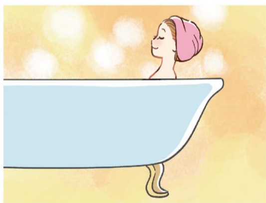
トリートメント時のスペシャルケアとして、蒸しタオルもおすすめです！5～10分お風呂で温まりながら行うと良いですよ！

コンディショナーは、髪の表面をコーティングし、キューティクルを保護してくれるものなので、髪の状態によ