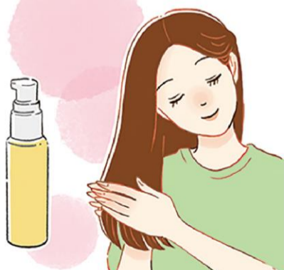
ヘアオイルは朝にもおすすめ♪紫外線や乾燥から髪を守ってくれます。スタイリング剤代わりに使ってもOKです

髪を乾かすときは、ドライヤーを10～15センチほど離し、髪を持ち上げたり、かき分けながら、根元から乾かします。ドライヤーの熱が1ヶ所に留まらないよう、小刻みに振りながら、乾かしましよう。前髪など、毛量が少なめのところは、弱温風で乾かすと良いですよ。弱温風のまま、手ぐしで髪を整えながら全体をさらに乾かし、仕上げに冷風をあてることで、キューティクルが引き締まり、まとまりも良くなります。