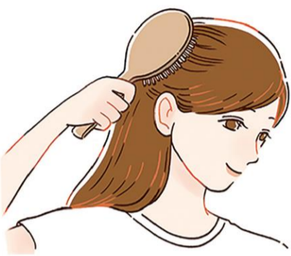
洗髪前にはブラッシングをすることで、髪の絡まりを解消し、シャンプー時の髪の摩擦を軽減したり、洗髪中に髪が引っかかって抜けることも防げます。

シャンプー後は、トリートメントを。髪に栄養を与え、ダメージを補修してくれる効果が期待できます。トリートメントを適量取り、手で広げて毛先からつけます。説明書にあるとおりの時間を置くことで、成分が浸透しやすくなります。ここで、目の粗いコームで髪をとかすと、トリートメントが均一に広がります。また、指や手のひらで髪を優しくなでやさしく撫でるようにならざることを、なめらかな質感が期待できます。ちなみに、地肌に付けると、毛穴詰まりの原因になるのでご注意ください。最後にしっかりと流しましう。