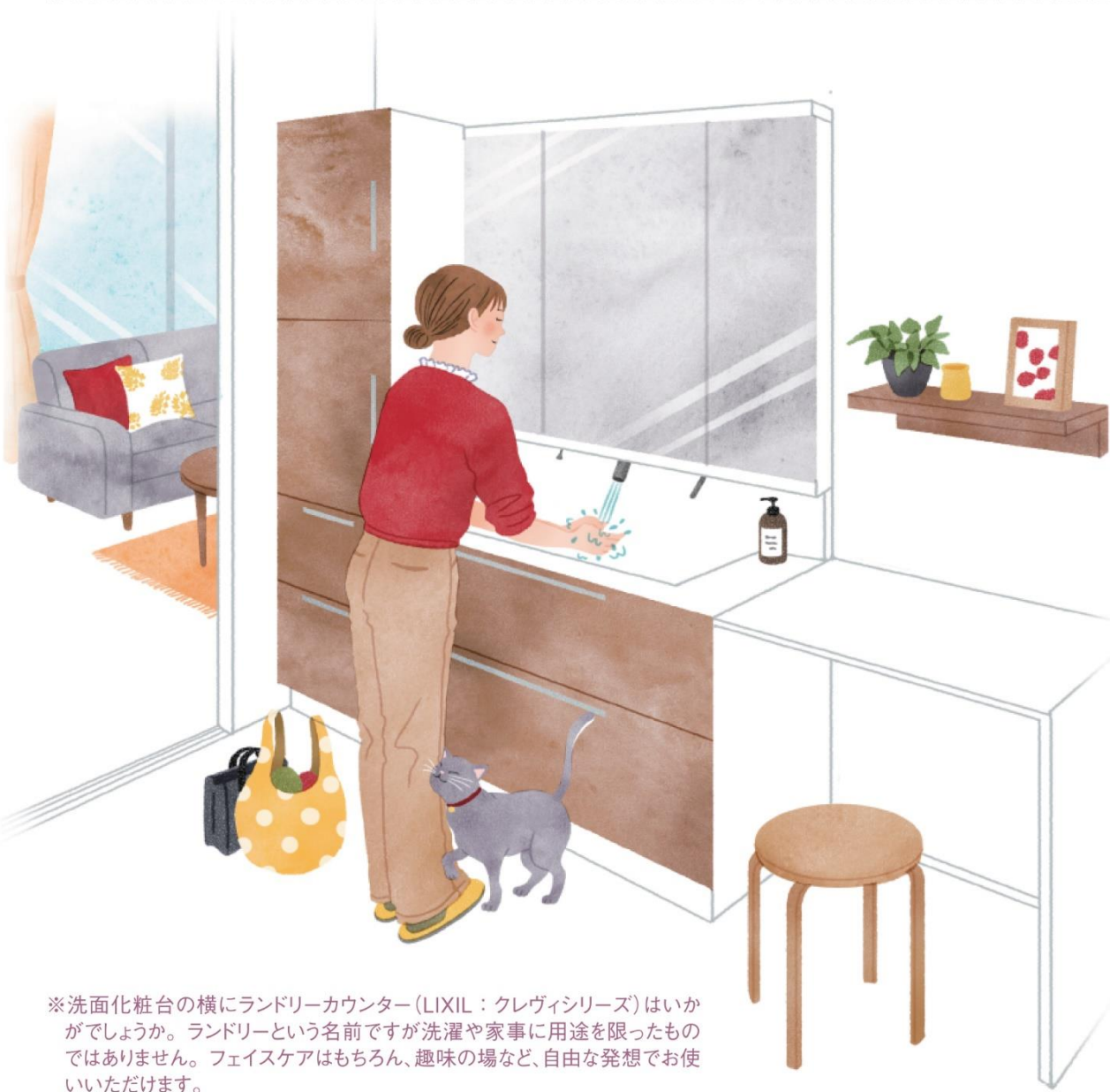
※洗面化粧台の横にランドリーカウンター(LIXIL:クレヴィシリーズ)はいかがですか。ランドリーという名前ですが洗濯や家事に用途を限ったものではありません。フェイスケアはもちろん、趣味の場など、自由な発想でお使いいただけます。

朝、家族が洗面に集中する「混雑問題」の緩和に、家事をちよっと便利にするためにも、趣味のスペースに。便利で快適なこのアイデアをぜひお試しください。